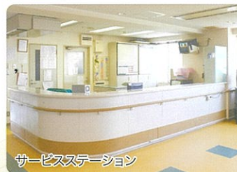
サービスステーション