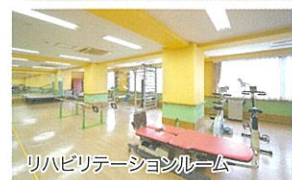
リハビリテーションルーム