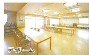
ダイニングルーム

当施設の手車で送迎を行い、ご家庭で療養されている方に、入所の方と同じようにリハビリテーション・入浴等を提供いたします。ご本人様の心身機能の維持・改善を図り、ご家庭での生活をより長く続けていただくことができるようお手伝いをいたします。