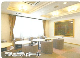
コミュニティホール